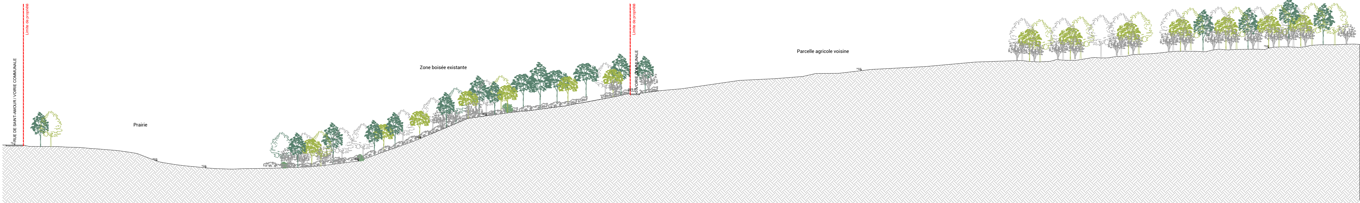
Coupe DD - Coupe transversale