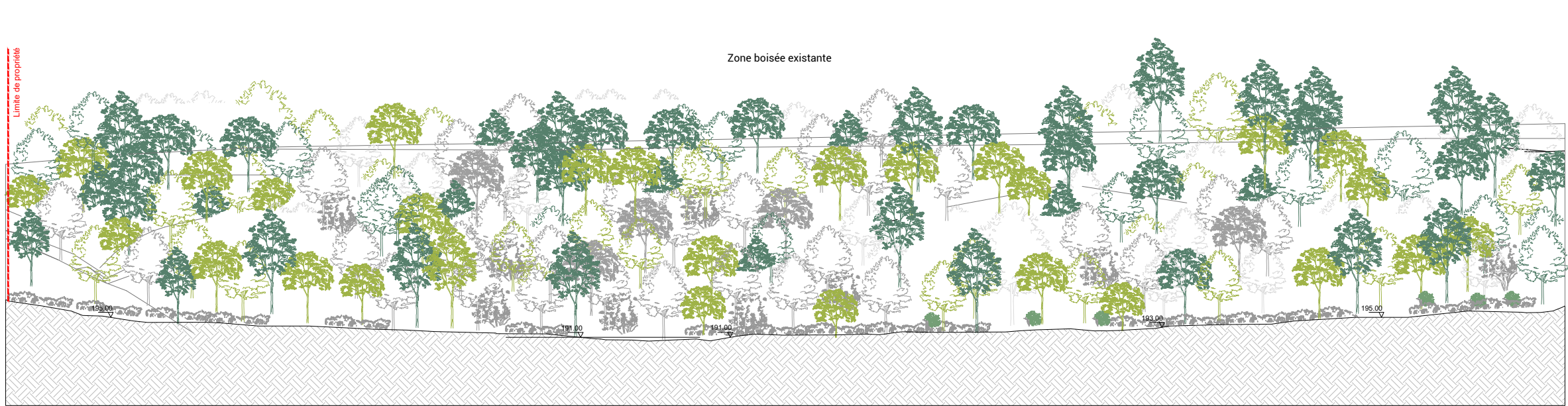
Coupe AA - Coupe longitudinale