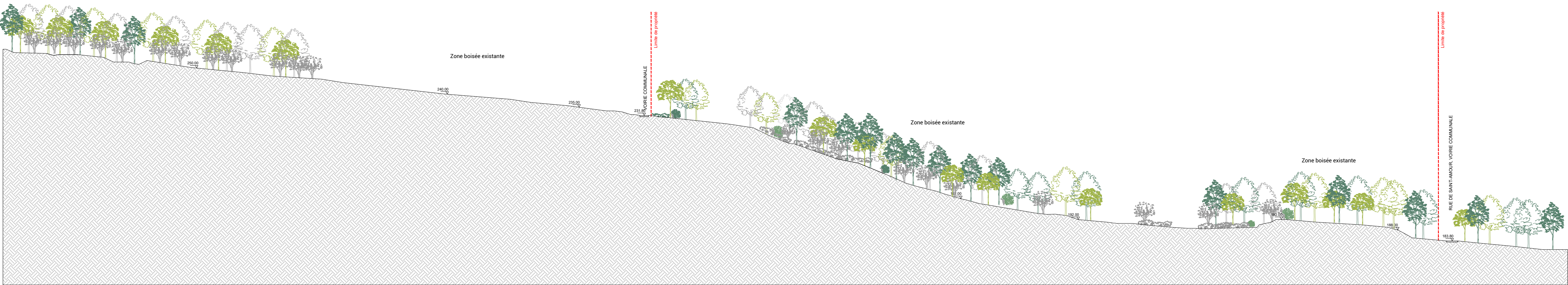
Coupe CC - Coupe transversale