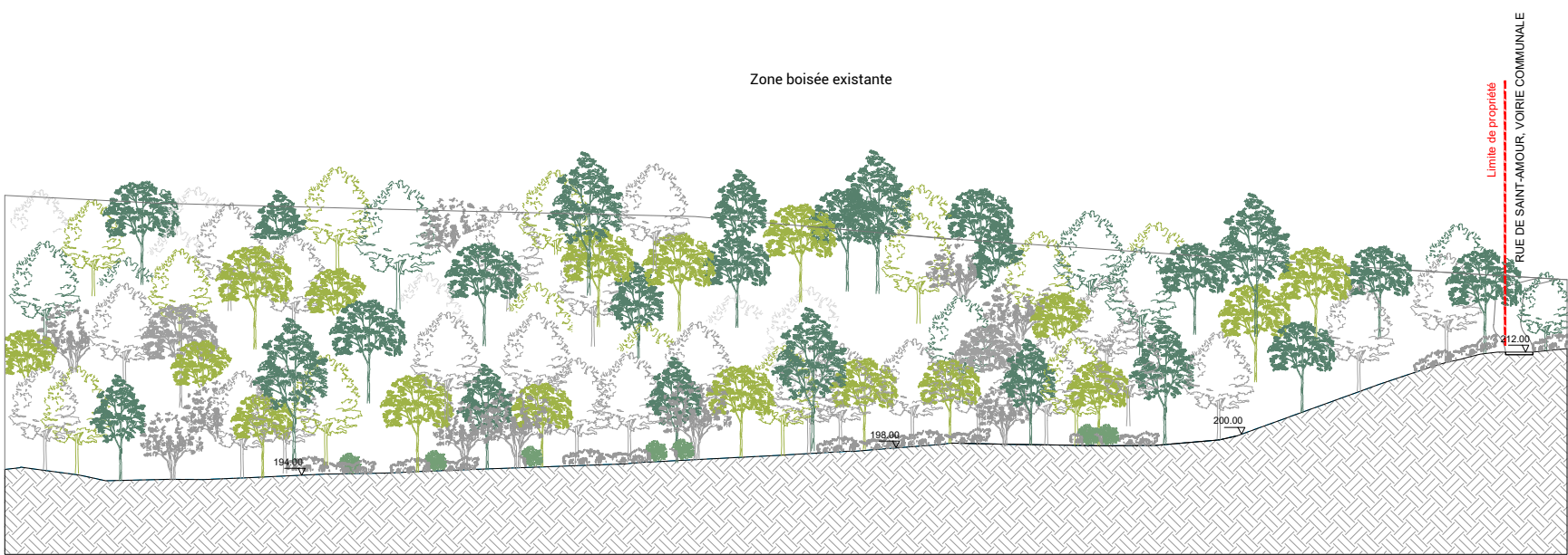
Coupe BB - Coupe longitudinale